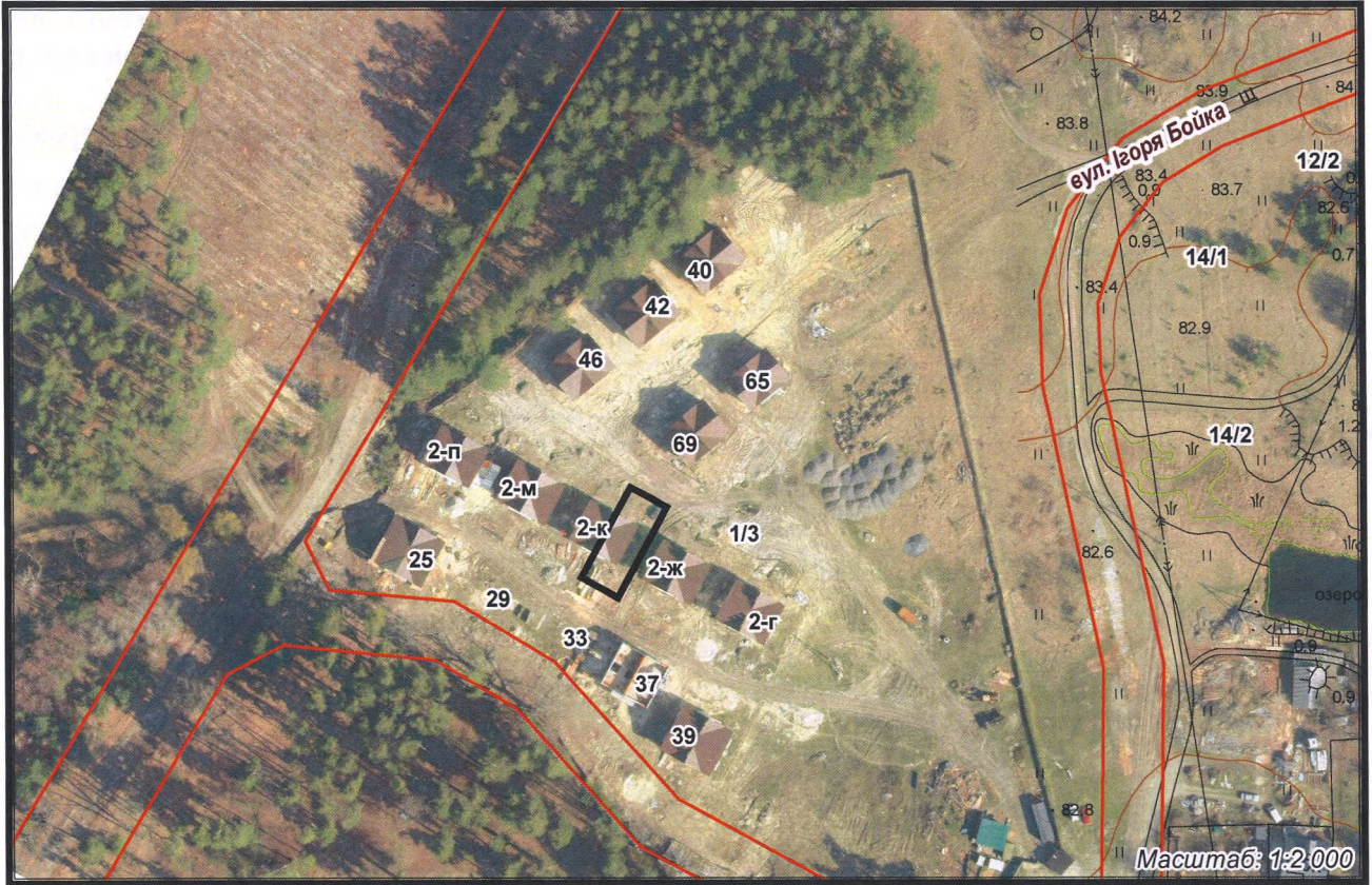
з ортофотоплану міста Черкаси

Поміщення містобудівної документації враховуються відповідно до рішення Черкаської міської ради від 15.06.2021 № 6/37