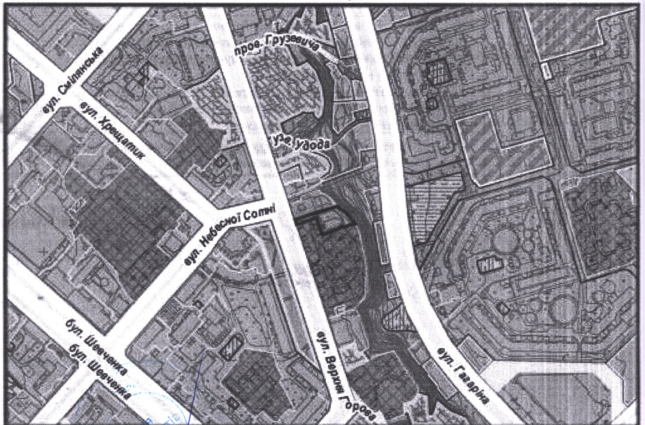
Масштаб 1:5 000

з містобудівної документації "Внесення змін до генерального плану міста Черкаси (Актуалізація)"