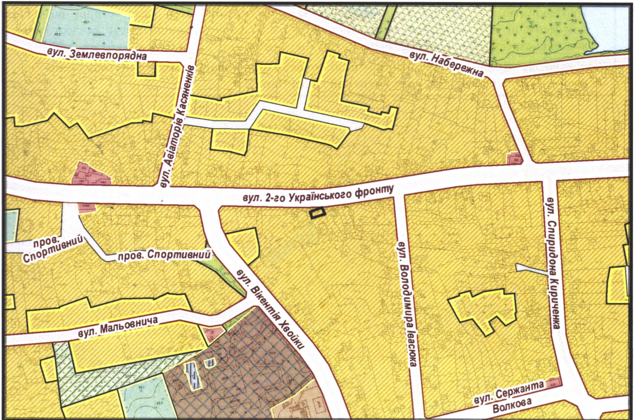
Масштаб: 1:5 000

з містобудівної документації "Внесення змін до генерального плану міста Черкаси (Актуалізація)"