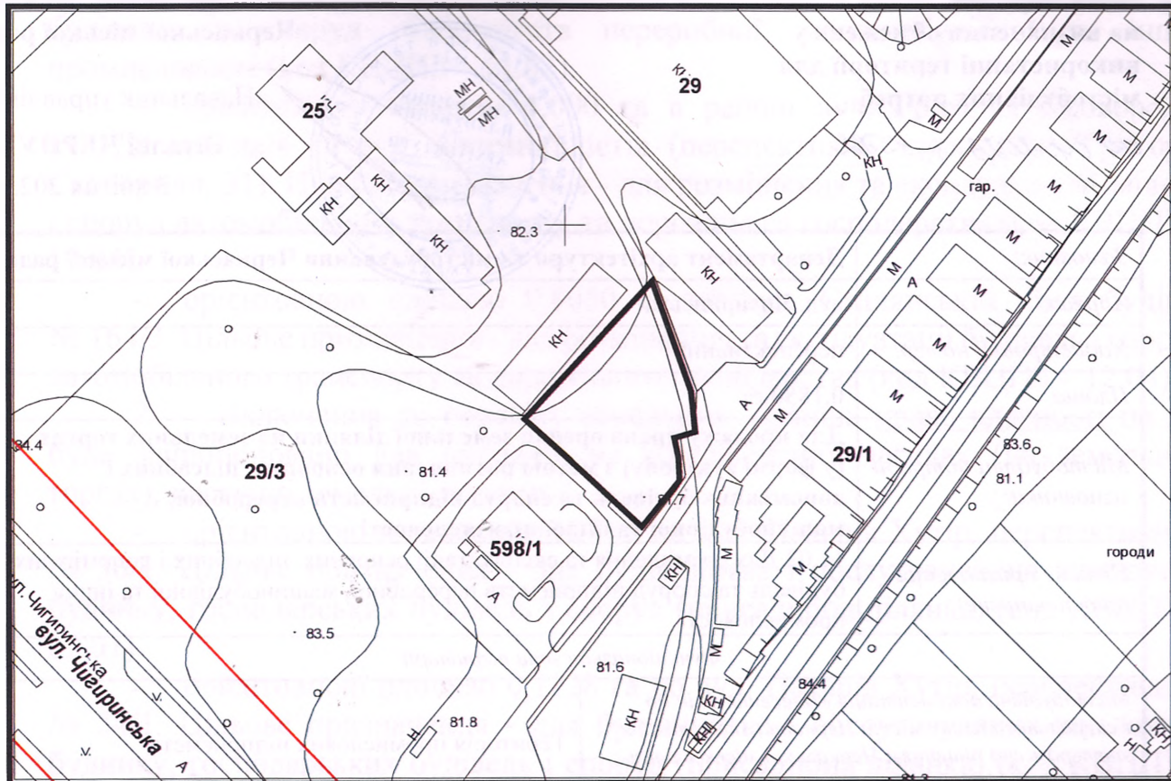
Масштаб: 1:2 000

з містобудівної документації "Внесення змін до генерального плану міста Черкаси (Актуалізація)"